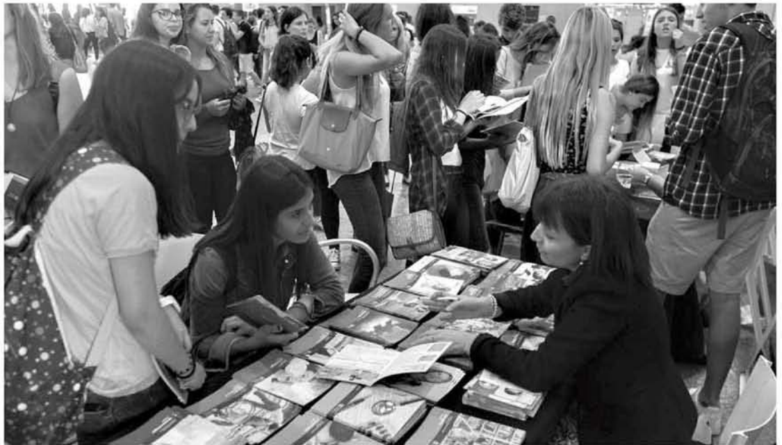
Los estudiantes tinerfeños se informan sobre la oferta de diferentes universidades europeas ayer, en una feria organizada en Santa Cruz.

Cabe destacar que la construcción de una nueva Facultad de Educación estaba entre las prioridades en materia de infraestructuras de la institución académica, pero las posibilidades de una nueva obra quedaron aparcadas, primero por la imposibilidad de acuerdo para la cesión por parte del Ministerio de Defensa de un espacio en el acuartelamiento del Cristo y posteriormente por los recortes presupuestarios. Hay que tener en cuenta que se trata de una de las facultades más grandes de la ULL, donde actualmente se imparten 15 titulaciones, además de varios títulos propios.