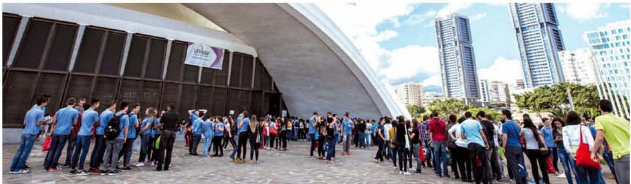
Los alumnos esperan para entrar a la feria organizada en el Auditorio de Tenerife. | JOSÉ LUIS GONZÁLEZ