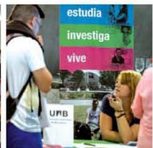
Un día para aclarar dudas. De izquierda a derecha, los jóvenes buscan asesoramiento en los diferentes stands del evento, las orientadoras explican la oferta de sus universidades a varias alumnas y el puesto de la Universidad Autónoma de Barcelona con su logo "Estudia. Investiga. Vive".