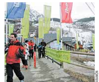
Estación de Cerler el domingo pasado.

EFE/ Las estaciones de esquí aragonesas en Huesca y Teruel prevén una alta ocupación turística para las próximas vacaciones de Semana Santa, ya que disponen de nieve en buena calidad y siempre que la meteorología acompañe. Empezará, tras las vacaciones, el cierre escalonado de las estaciones, aunque Candanchú espera abrir hasta el 18 de abril.