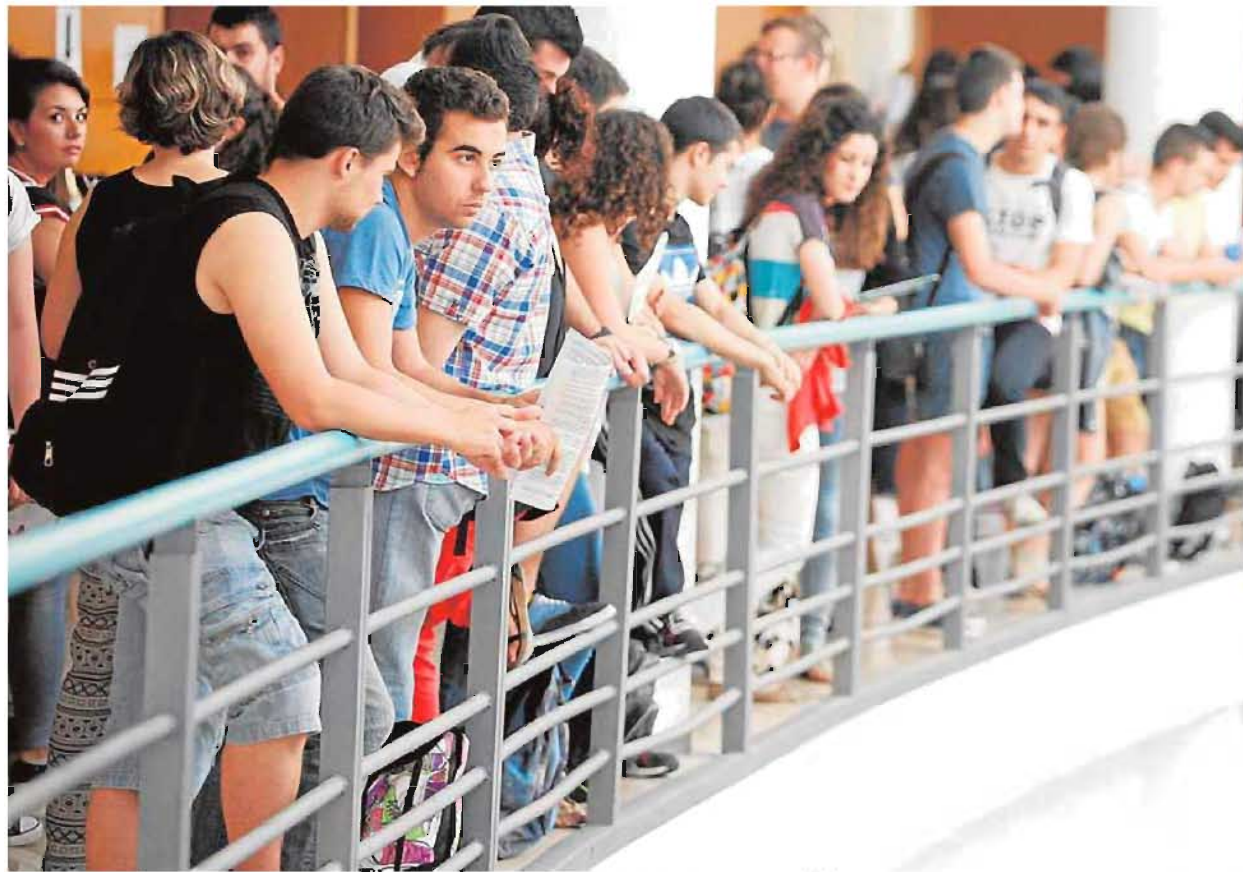
Alumnos antes de entrar a hacer las pruebas de selectividad en la Universidad de Alicante.

Cuando se les pregunta por sus opciones laborales, las cifras cambian. El 37% de los jóvenes de Alicante asegura que le es indiferente dónde trabajar y se irá a vivir don-